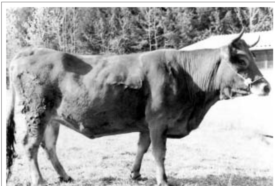
Fig. 1. Soggetto di razza Pontremolese. Pontremolese cow.

Dalle misure da noi rilevate (Tab. II) sembra evidenziarsi un cambiamento del tipo morfologico verso una mole più ridotta rispetto al tipo descritto nel 1935.