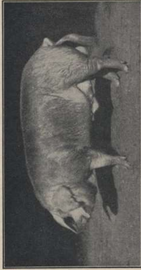
Fig. 36. — Suino di grande reddito Stanga.