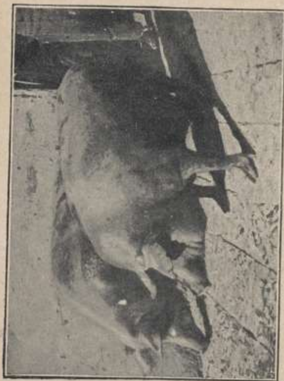
Fig. 30. - Maiali grigi di razza Casertana.

e del Volturno, i quali trovansi lungo i litorali del Tirreno nei circondari di Caeta e di Caserta, e si estende nell'interno, sino al mandamento di Cajazzo nel circondario di Piedimonte d'Alife, sino ai mandamenti di Pj-