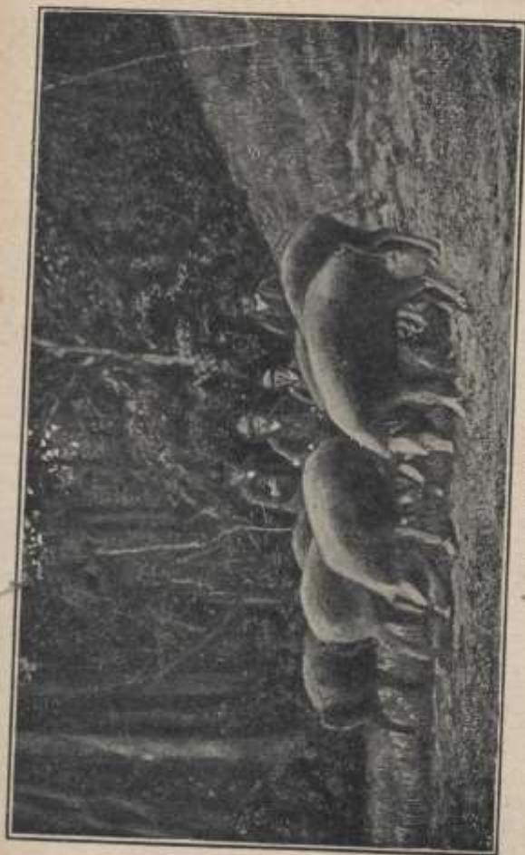
Fig. 33. - Maiali Chianini allo zibonduccare.

Vi è pure la razza Chianina (fig. 33), la quale così è descritta dal Marchi: « È un po' più alta di gambe della romana, ha il corpo meno cilindrico, la groppa piovante, le setole più rade e fine, il mantello più chiaro (grigio-ardesia) spesso con balzane e col muso bianco, decolorazione questa che se non le si oppone la selezione, tende ad estendersi, ed allora comparisce una macchia bianca al garrese, oppure una dietro al gomito che nella discendenza possono estendersi ancora ed avere