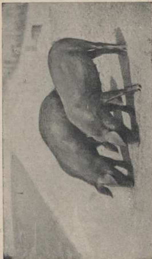
Fig. 34. - Porci di razza Bolognese.

In seguito all'importazione fra noi delle razze inglesi Yorkshire e Berkshire, che ebbe il suo inizio verso il 1872 per opera del Ministero di Agricoltura, colle quali si procedette all'incrocio continuo colle razze indigene allo