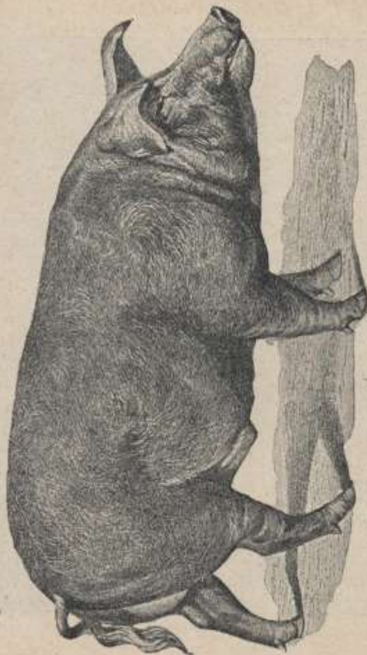
Fig. 38. - Verro Poland China.

9. RAZZA CRAONESE (fig. 39). — Questa razza si trova nel dipartimento della Mayenne ed è ancora designata sotto il nome di razza mancelle od angevine perchè occupa soprattutto le antiche provincie di Maine o dell'Anjou. Nel circondario di Chateau-Goutier essa è oggetto di migliori metodi di allevamento, e qui la piccola città di Craon si distingue per le cure speciali che ha per