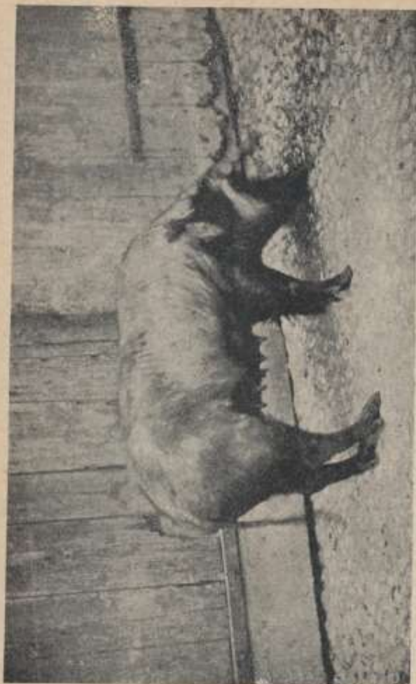
Fig. 36. — Porco di razza Fritulana.