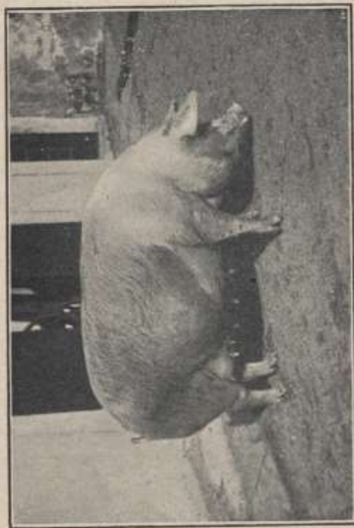
Fig. 31. - Scrofa mezza sangue York-Casertina.

Si sono fatti anche incroci York-Casertini e Casertini-York con risultati soddisfacenti. I primi esperimenti si sono fatti dal Prof. Baldassare alla R. Scuola Superiore d'Agricoltura di Portici (figura 30-31) ma però se ne