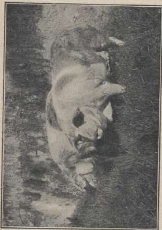
Fig. 32. - Scrofa piccola sangue Casertina-York.