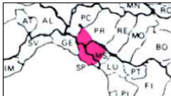
Fig. 2 - Zone de diffusion de la race Pontremolese en 1940 (Calamari e Faverzani, 1997)

P. Secchiari, M. Mele, A. Serra, G. Ferruzzi, A. Pistoia DAGA, Settore Scienze Zootecniche - Università di Pisa